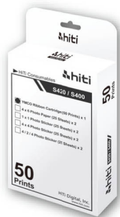
▲ 50 入相紙列印包