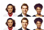
▲ 50 x 50 mm