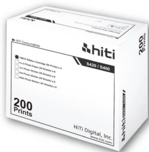
▲ 200 入相紙列印包