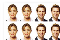
▲ 35 x 45 mm